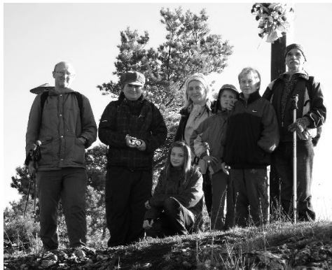
pohoda na Vyšehrade